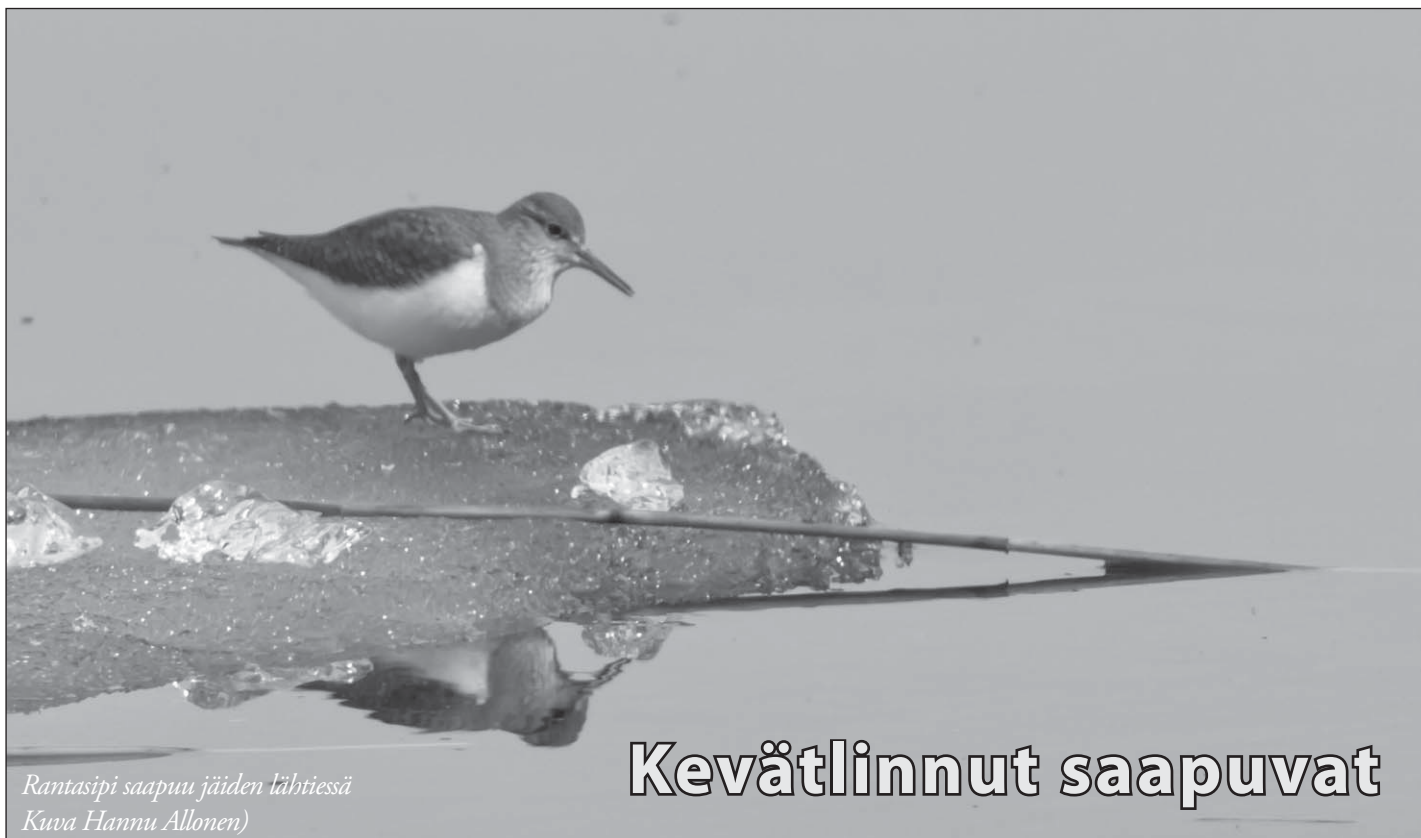
Rantasipi saapuu jäiden lähtiessä